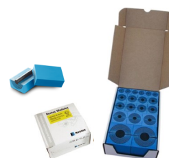
Zubehör nicht im Lieferumfang inbegriffen